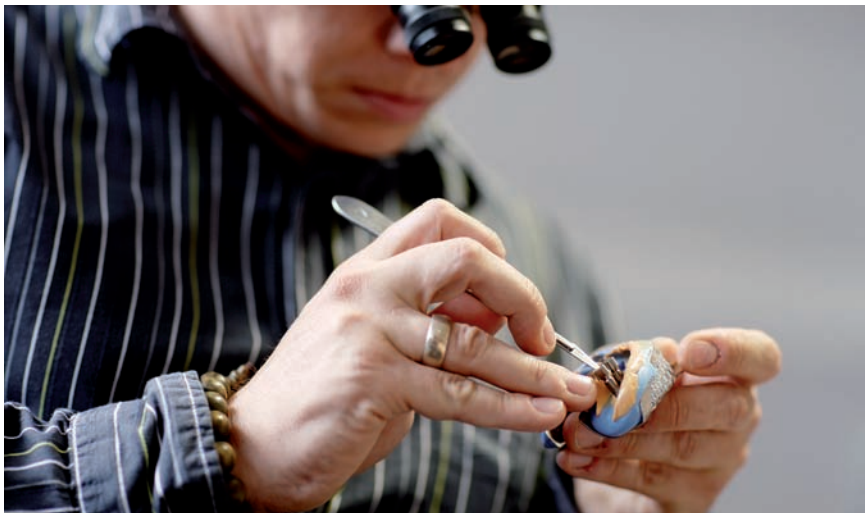
Kontrolle des Abdrucks noch vor der Reise nach China in der Mülheimer Zentrale der MDH AG

Aus diesem Grund ist es sehr wichtig, dass der Zahnarzt, der seinen Patienten preisgünstigen Auslandszahnersatz anbieten möchte, einen erfahrenen, kompetenten und qualifizierten Partner findet. Ein solcher Partner ist die MDH AG (Mamisch Dental Health AG, Mülheim) MDH betreibt ein Dentallabor in Mülheim und ein Labor in China. Alle Arbeiten, die bei den Zahnärzten innerhalb von zwei