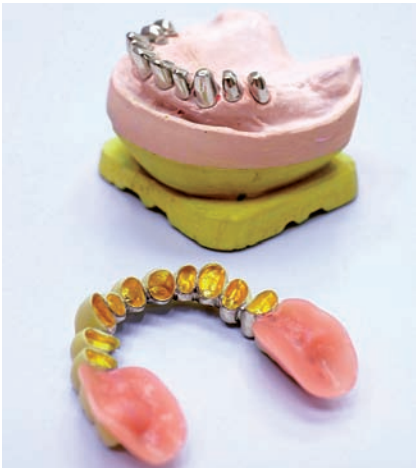
Teleskoparbeit mit Galvano-Sekundärteilen